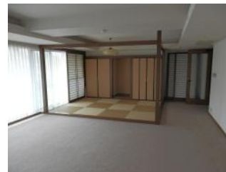
リビング畳コーナー付