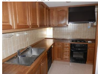
L型システムキッチン