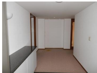
広々とした玄関スペース